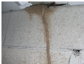
Cordonnet de termites